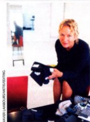
La styliste Agnès B. (Galerie du Jour). Une réussite artistique tout juste à l'équilibre.