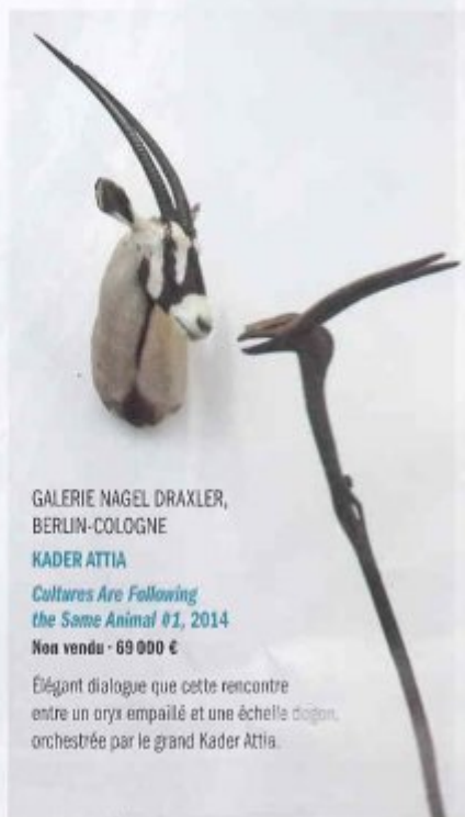
GALERIE NAGEL DRAXLER, BERLIN-COLOGNE KADER ATTIA