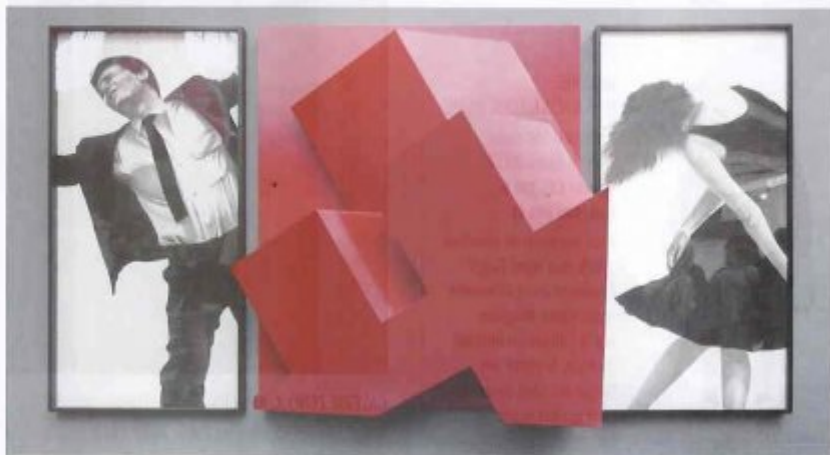
GALERIE NATALIE SEROUSSI, PARIS ROBERT LONGO New in the City , 1982-1983 En cours d'achat - entre 1 et 1,2 M€ Une œuvre rare du virtuose du dessin américain, en ce qu'elle mêle deux de ses silhouettes cultes à une sculpture abstraite, plus surprenante dans son corpus.

Voilà l'une des rares galeries qui aient tenté le stand coup d'éclat, un genre en perdition depuis quelques années.