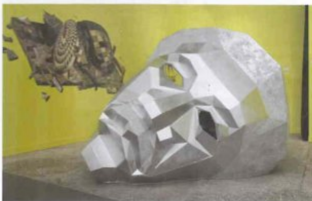
GALERIE ANNE DE VILLEPOIX, PARIS DERRICK ADAMS We < Here , 2013 Non vendu - 40 000 €

Sentiment de fin du monde pour la belle exposition de ce jeune espoir venu du Kosovo, l'une des meilleures qui aient eu lieu en galerie pendant la Fiac : après sa vision désespérée du Muséum d'histoire naturelle muré de sa ville natale, qu'il a reconstruit l'an passé, Petrit Halilaj compose un double paysage très prégnant. Passé un buisson d'ocarinas, instrument de musique ancestral qui remonte au néolithique, le visiteur pénètre une forêt à terre, que domine un cheval glauque sur un étang d'un rose intense. Le tout sous une lumière fade qui renforce l'inquiétante étrangeté de l'ensemble.