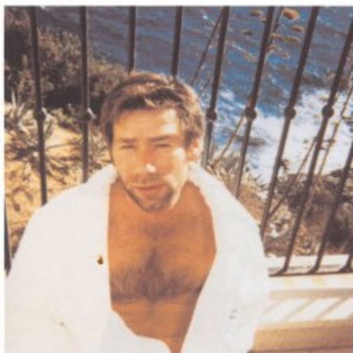
Mat vu par Tracey

Elle vend pour 650 000 francs un patchwork à la FIAC et répond aux questions de David Bowie pour le Harper's Bazaar , pendant que son compagnon tient les collectionneurs en haleine à Londres comme à New York et Genève. Issus de la scène anglaise et estampillés YSBA, ces enfants terribles se sont propulsés en dix ans des trottoirs aux lambris. Leur idylle donne ici lieu à une confession croisée.