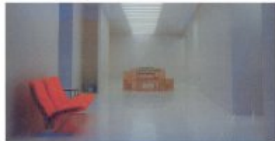
Vue de l'intérieur de la galerie Kreo, Paris, courtesy galerie Kreo, Paris : photo prise depuis Textérieur

À l'évidence, les architectes ont apporté aux galeristes une meilleure compréhension de l'espace, du lieu et du parcours. En échange, les galeristes ont fourni aux architectes une autre approche de l'art contemporain dans tous ses états et, probablement, un sens de l'effacement salutaire.