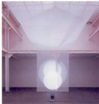
Vue panoramique de l'installation de Michel Verjux à la galerie Durand-Dessert, Paris, 1998 :

Plus récent point de fixation du parcours capital, la rue Louise-Weiss (13 e arr.). Là, les galeries se sont installées aux rez-de-chaussée