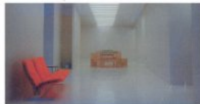
Vue de l'intérieur de la galerie Kreo, Paris, courtesy galerie Kreo, Paris : photo prise depuis Textérieur

de Bretagne à Nantes, le Musée des beaux-Arts de Tourcoing, celui de Cambrai, le Centre Pompidou version 2000 (Musée national d'art moderne et bibliothèque publique d'information), entre autres, lui doivent beaucoup. Nombre