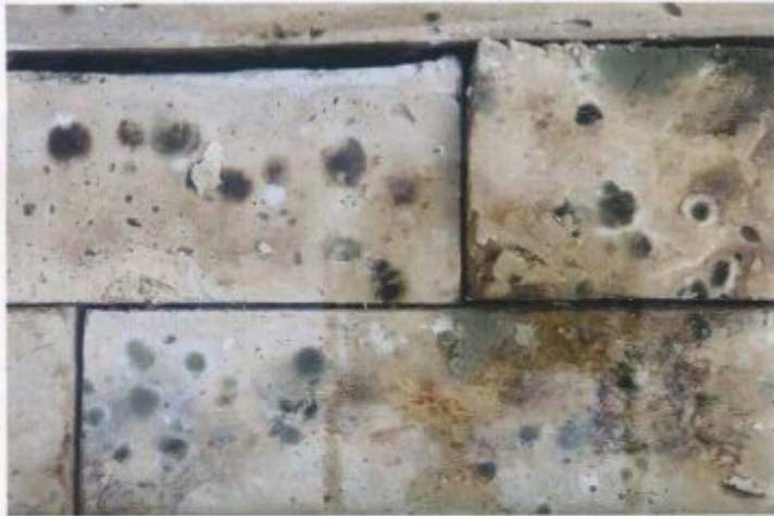
Was da wächst, ist Kunst: die Schönheit des Schimmels

zu lassen. Es hat nicht geklappt, das arme Tier ist nach zwei Monaten gestorben. Ich möchte das irgendwann als Kunstprojekt wiederholen. Bloß nicht bis zum Tod!